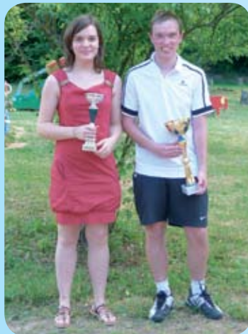
Les vainqueurs du Tournoi Interne 2014 de tennis

La traditionnelle Fête du Tennis et les finales du Tournoi Interne ont permis de réunir de nombreux participants autour d'un barbecue, pour clôturer l'année sportive 2014.