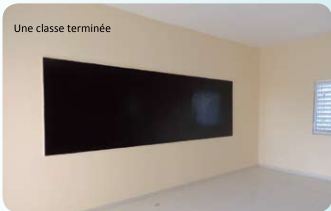
Une classe terminée

Dans le précédent bulletin, nous vous avons parlé de ce beau projet, à savoir le séjour au Sénégal de 10 jeunes de l'établissement d'Ingwiller. Le virus Ebola a eu raison du départ au mois de janvier qui devrait être juste retardé dans l'année.