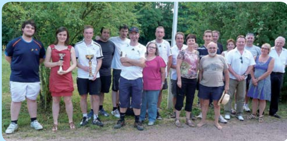
Les vainqueurs, organisateurs et personnalités.

Après des vacances bien méritées, il était temps de penser à reprendre les activités :