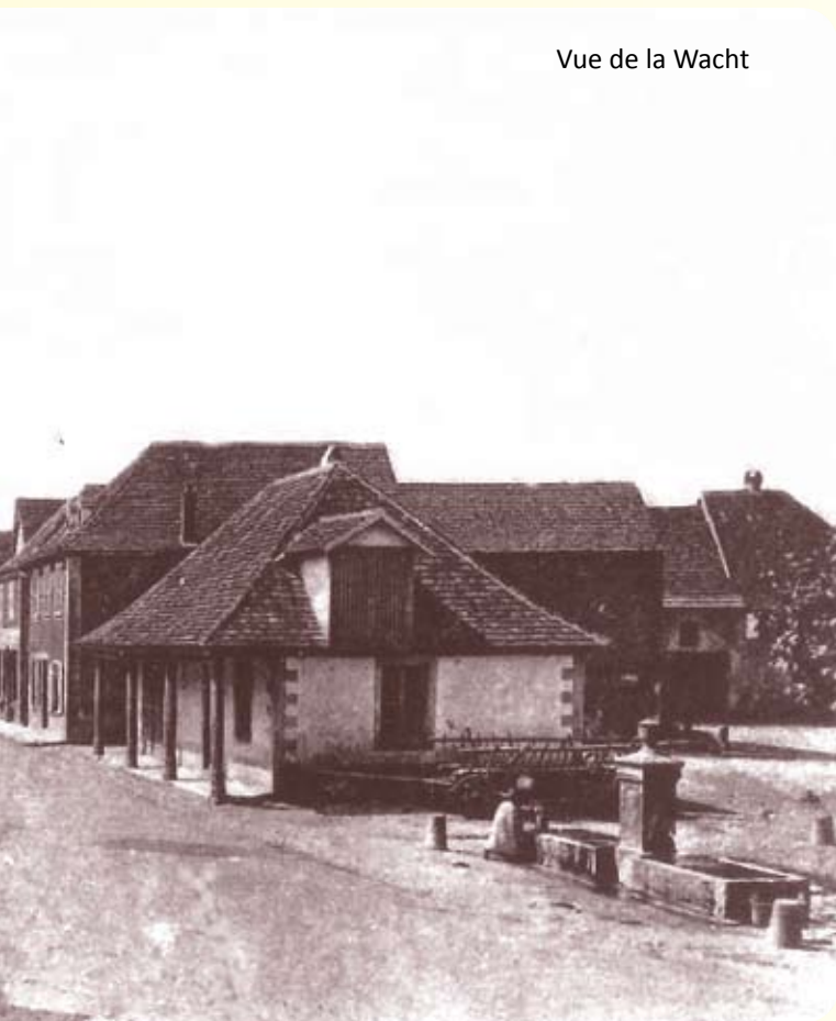
Vue de la Wacht