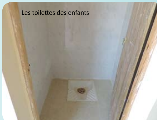
Les toilettes des enfants